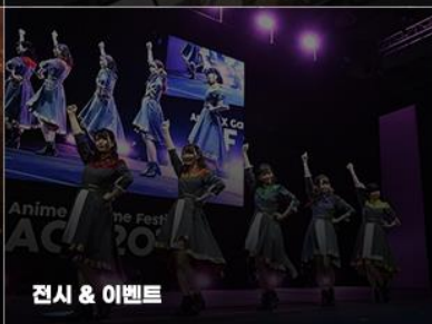
전시 & 이벤트