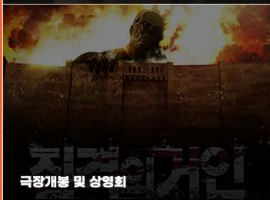
극장개봉 및 상영회