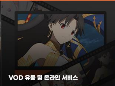
VOD 유통 및 온라인 서비스