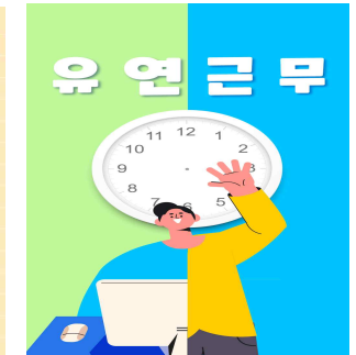
< 탄력근무/재택근무 등 >