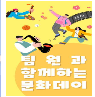
< 분기별 1회 16:00 퇴근 후 >