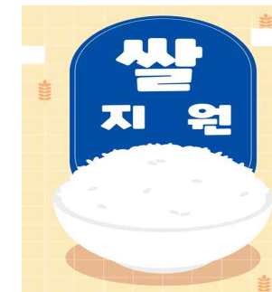
< 점심식사 쌀 지원 >