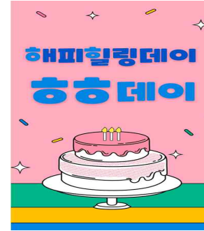
< 생일 휴가 및 축하선물 >