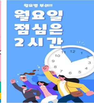
< 11시~13시 / 12시~14시 >