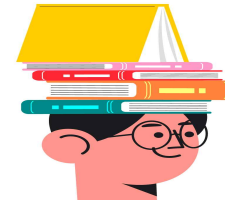
< 연간 2회 >