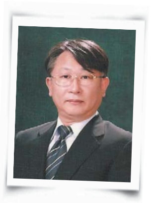
이자원 본 센터 소장, 영어교육 전공 교수

인간은 변화와 불가분의 관계라고 할 수 있다. 인간의 과거와 현재와 미래는 일견 시간으로 나누어져 있는 것 같지만 변화전, 변화중, 변화후로 나누는 것도 타당하니 인간과 변화는 어쩔 수 없이 붙어 있는 관계인 셈이다. 인간은 세대를 거치면서 조상들로부터 정신적인 유산을 물려받지만 자신이 처한 환경과 맞도록 적절한 변화를 꾀하여 다른 모양으로 바꾸게 되어 있으니 변화와의 관계는 떼어 내려고 해도 뗄 수 없는 관계가 되는 것이다. 지구상의 생명체 중에서 환경에 순응하지 않고 도전적으로 환경을 바꾸려고 하는 것도 인간뿐일 것이다. 이런 면에서 보았을 때 교육도 예외는 아니다. 세상은 순식간에 바뀌고 해마다 학생들의 욕구가 달라지니 가르치는 방식도 변화를 맞이해야 하는 것은 어쩔 수 없는 일이다.