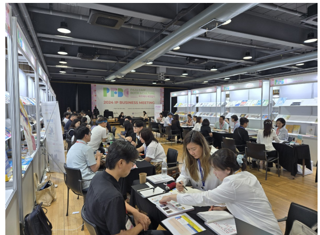
[글로벌 수출상담회] - 2024.09 - 경기도 파주 - 국내기업 30개사 / 해외바이어 17개사 - 수출상담회, 세미나, IR피칭