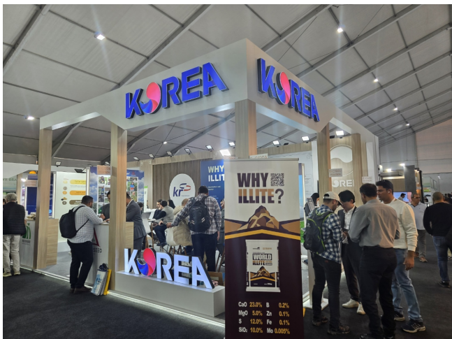
[해외전시회 한국관] - 2024.11 - 튀르키예 안탈리아 - 국내기업 10개사 / 해외바이어 199개사 - 해외전시회 한국관 운영