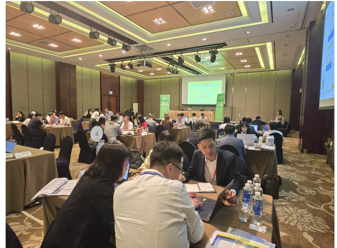
[해외로드쇼] - 2024.08 - 베트남 호치민 - 국내기업 15개사 / 해외바이어 30개사 - 수출상담회, 네트워킹 리셉션