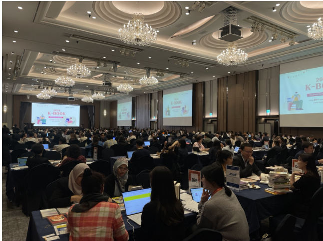
[글로벌 수출상담회] - 2024.06 - 서울 - 국내기업 98개사 / 해외바이어 100개사 - 수출상담회, IR피칭, 네트워킹 리셉션