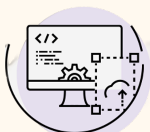
ICT (Consulting, SI, SM, UI Design)